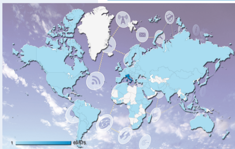
Nella cartina, in azzurro, i 135 paesi dai quali ci si è collegati al sito per la visualizzazione di pagine e contenuti

S ono 9 le sezioni dedicate alle notizie: Editoriali, Attualità, Primo Piano, Chiesa, Diocesi, Cultura, Sport, Bacheca, Territorio più la sezione speciale dedicata alla GmG 2016 di Cracovia . Uno spazio importante è riservato alle rubriche dove vengono raccolte le storie provenienti dalle "Associazioni", dai "Diari di Viaggio", "Parrocchie" e "Testimoni di fede". Arricchito nei contenuti grazie alla possibilità di ospitare video e gallerie fotografiche , la sezione Media ospita più di 50 video tra quelli caricati sul canale video di YouTube "PdV Channel". Nella sezione dedicata agli abbonati (alla quale è possibile accedere registrandosi al sito), è possibile visionare e scaricare tutti i numeri e i Quaderni di Parola di Vita dal 23 aprile 2008 fino ad oggi. Ancora nella home l'area riservata all'"Ultim'ora" con le notizie del sito che si aggiornano in ordine di arrivo e il widget del Servizio di Informazione Religioso, e quello con i siti internet di Avvenire, Centro Televisivo Vaticano, News.Va, TV2000 e Parrocchie Map .