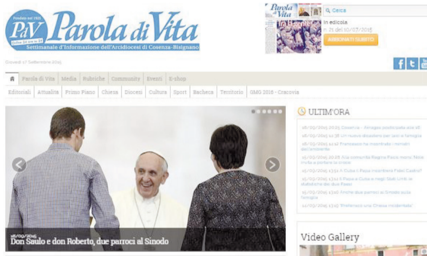
La home del sito del Settimanale di informazione diocesano